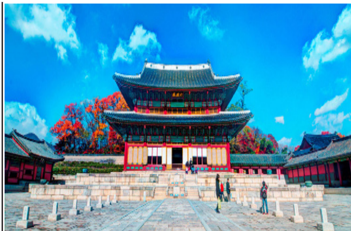
changdeokgung palace, South Korea